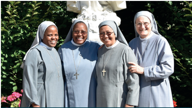
Le piccole Suore di Santa Teresa con il compito di accogliervi nella Casa della famiglia Martin