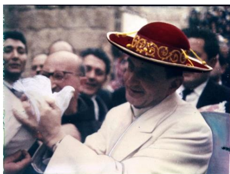
Paolo VI libera una colomba

Inoltre, in quegli anni, i movimenti non violenti e pacifisti cercavano un simbolo comune che li rappresentasse. Nacquero così diversi simboli o bandiere della pace.