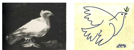
Colombe della pace di Picasso (1949 e 1961)

L’associazione della colomba con i movimenti pacifisti avviene nel 1949 quando Pablo Picasso disegna una colomba bianca a terra su sfondo nero per il congresso della pace promosso dal partito comunista francese. Lo stesso artista negli anni successivi tratteggerà la colomba in volo con il ramoscello d’ulivo in decine di versioni diverse, imponendolo come simbolo della pace.