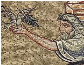
Noè e la colomba (Monreale)

In san Giovanni della Croce il simbolo della colomba non ha un solo significato, nemmeno nei testi in cui lui stesso associa la colomba del diluvio con il ramo di ulivo in becco alla misericordia. Principalmente la colomba è l'anima che cerca l'unione d'amore con Dio (cf. Cantico spirituale , str. 14-15,1). Il testo più dettagliato, anche dal punto di vista allegorico e simbolico, è il seguente: